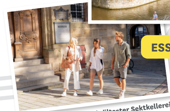
Historische Altstadt mit ältester Sektellerei Deutschlands