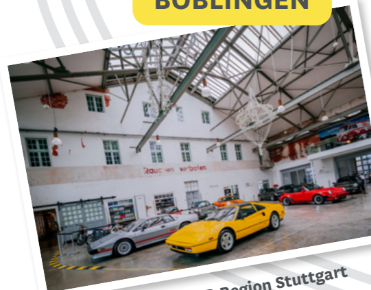
MOTORWORLD Region Stuttgart

Genau das Richtige für Fahrzeugliebhaberinnen, Nostalgiker und Ästheten: In der Motorworld steht eine täglich wechselnde Sammlung von Fahrzeugen zum Anschauen und Bestaunen. www.motorworld.de