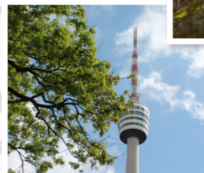
SWR Fernsehturm Stuttgart

TIPP: Im verwunschenen Weißenburgerpark steht das Teehaus mit seinem Biergarten. www.teehaus-stuttgart.de