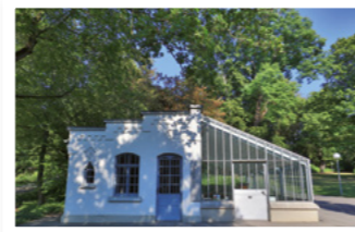
Gedächtnisstätte Bad Canstatt